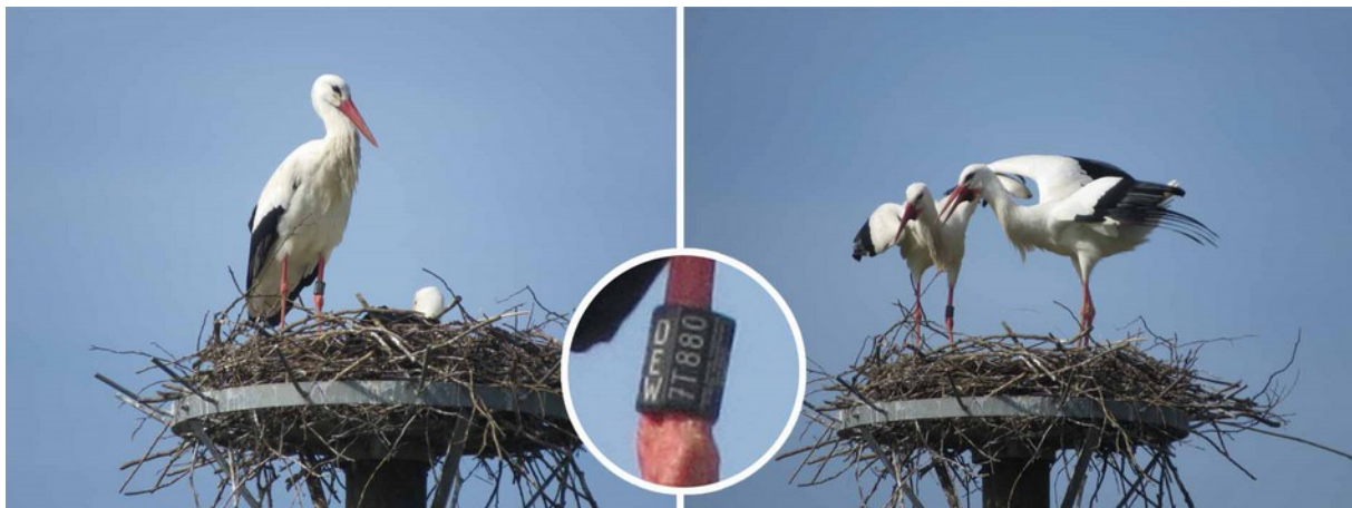
Störche bei Rüdighelm

Auf dem Storchmast bei Rüdighelm standen 2 Weißstörche, das Weibchen „saß“ zeitweise und bei dem Männchen konnte zweifelsfrei der Ring abgelesen werden. Die Nummer lautet: DEW 7T880 – somit handelt es sich um einen zweijährigen Storch, der bei Hachborn beringt wurde. Bleibt zu hoffen, dass er bereits die nötige Brutreife besitzt.“