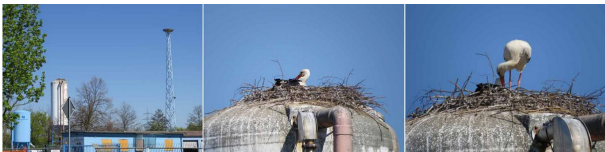
Brutsituation der Störche am Bauhof Heskem