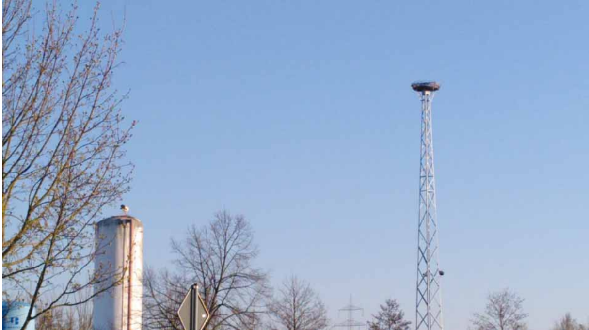
Auf dem Mast sollte er; auf dem Silo (links im Bild) will er...