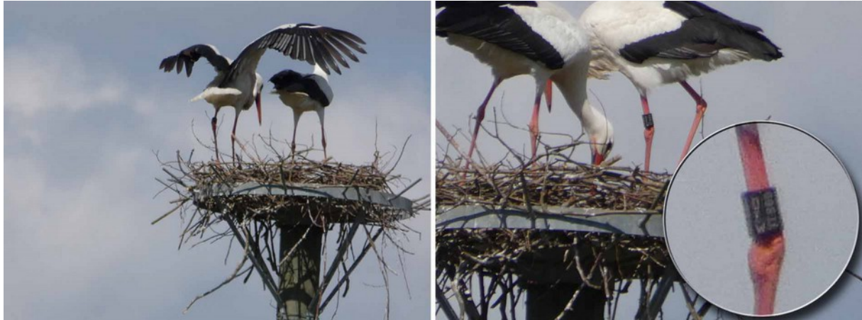
Storchenpaar bei Rüdigheim. ♂ DEW 7T880

Um 16 Uhr war das Nest nicht besetzt. ...“